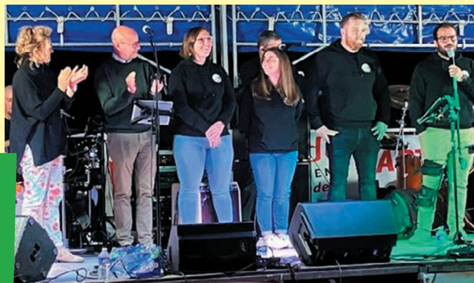
Événement du 1 er octobre 2022 pour la solidarité des pompiers.