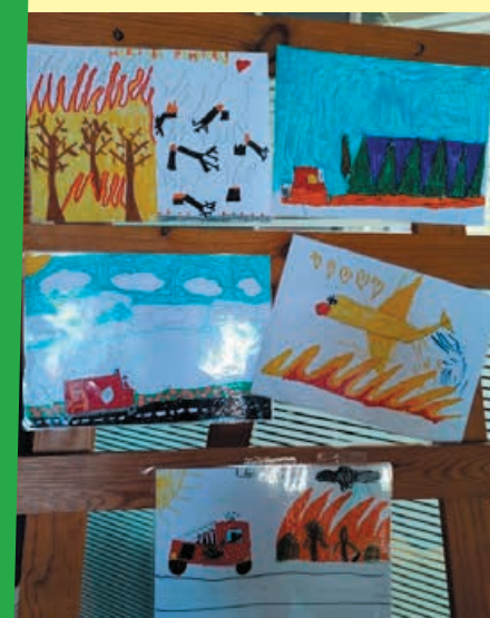
Dessins offerts à la Mairie, réalisés par les enfants du centre de loisirs suite à un atelier de prévention contre les incendies.