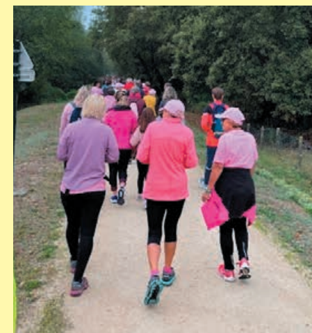
Octobre rose du 2 octobre 2022 en partenariat avec le cyclo club de Captieux. Environ 100 participants dont la somme récoltée a été totalement reversée à l'association du rubans roses.