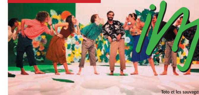
Toto et les sauvages